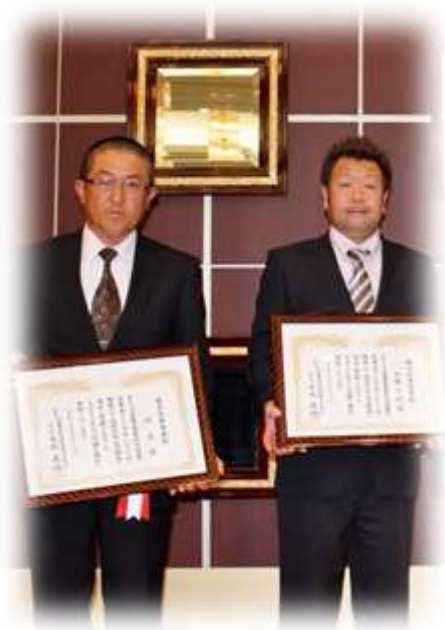
長野県資源循環保全協会優良従事者表彰 (写真掲載の許可を協会に確認済です)